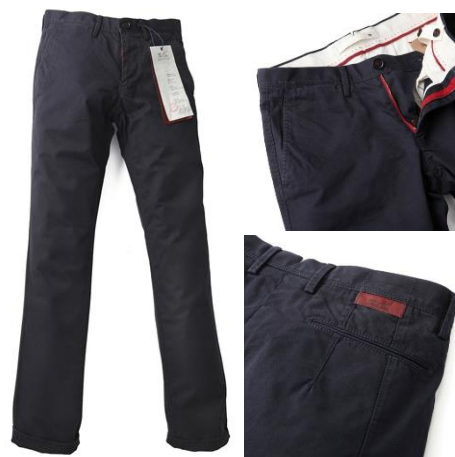
TCR1430202 – Semi-slim fit ¥19,000-(税抜)