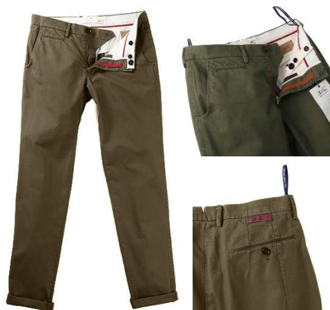
TCR1430201 – Slim fit ¥19,000-(税抜)

もう一つのシグネチャーモデル、セミスリムフィットMD-201 細めのラインだが渡り幅、裾幅は程よい太さのストレートラインを持った 大人に向けたオーセンティックなチノパンツ。