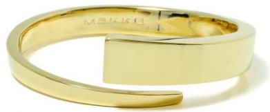
GOLD WRAP BANGLE