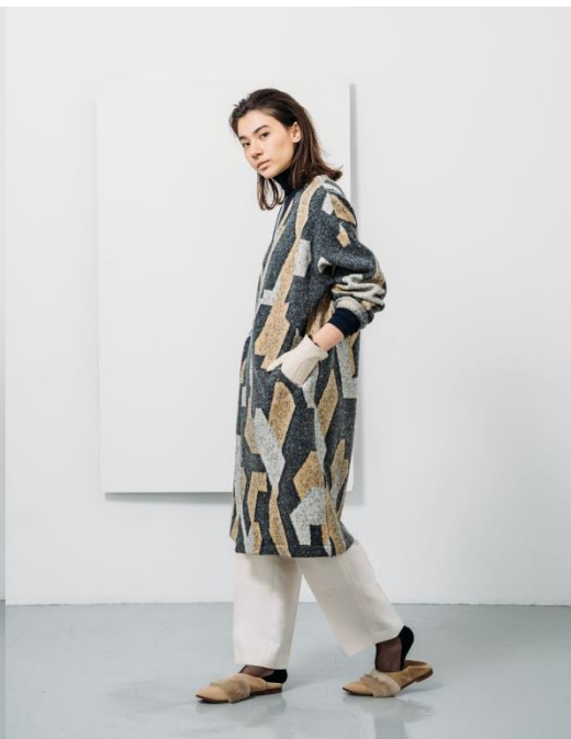
ジャケット27,000円、カットソー18,500円、パンツ32,000円 コート42,000円、パンツ32,000円