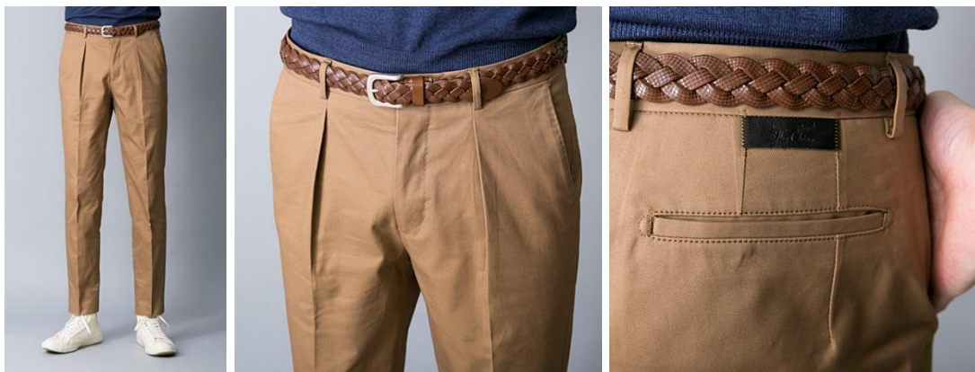
TCR1630222 Wide tapered fit - ¥23,000

タテ糸にインディゴ糸、横にストレッチを効かせた欧州SPOERRY社のIce Cotton糸を打ち込んでいる事により触感冷感とドライタッチが得られます。夏に暑くなりしがちなデニム素材も快適です。