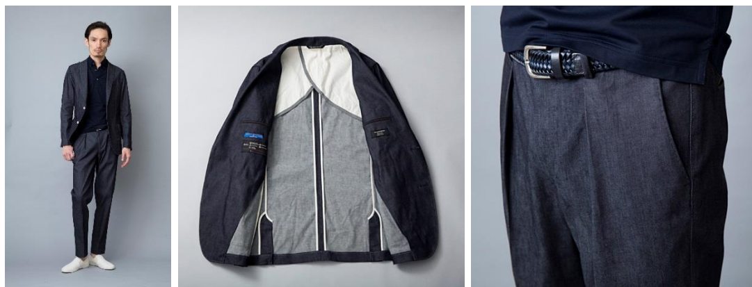
TCR1710113 (jacket) - ¥43,000(税抜), TCR1710213(trousers)- ¥24,000(税抜)

フロントに深い2タックを配したワイドシルエット。ヒップ周りから裾にかけ綺麗にテーパードしています。